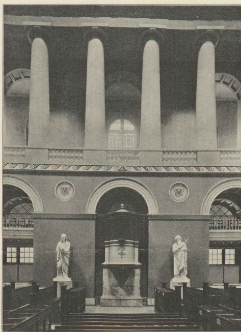
Afb. 46. Fra Kirkens Midtskib med Prædikestolen.

Paabegyndt som Sognekirke i en lille Havneby voksede dens Betydning med Byens; allerede tidlig blev den en biskoppelig Kollegiatkirke, i hvilken senere, da København blev Residensstaden, Danmarks Konger kronedes igennem 200 Aar; ved Reformationens Frembrud mødtes gammelt og nyt her voldsommere end noget andet Sted i Danmark med Billedstormens Rasen. Efter Reformationen fæstnedes dens Stilling yderligere, den blev Universitetets og den lærde Verdens Kirke, den blev den lutherske Bispetids og Landets Hovedkirke; under dens Hvalvinger begravedes Landets ypperste Mænd, og Epitafium ved Epitafium vidnede — som i et dansk Pantheon — om dens Stilling og Betydning.