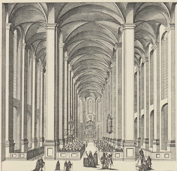
Afb. 24. Kirkens Indre efter Branden 1728.